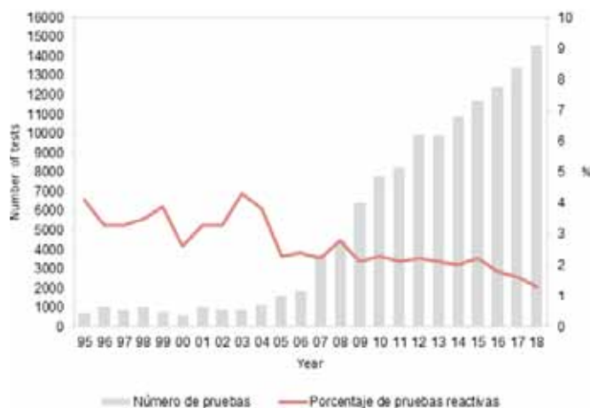
Figura 1 Número de pruebas realizadas y porcentaje de pruebas de VIH reactivas en la red DEVO entre 1995 y 2018.

DMM: Dublin Declaration Monitoring indicator; (*) se excluyen las personas que tienen un diagnóstico de VIH de hace más de 12 meses; (**) base: PID que han tenido alguna pareja estable y/o ocasional, respectivamente, en los últimos 6 meses; (***) base: Mujeres TS que han tenido clientes fijos, no fijos y/o parejas estables, respectivamente, en los últimos 6 meses; (†) base: Número de trabajadores sexuales que declaran haber mantenido relaciones sexuales comerciales, ocasionales o estables respectivamente en los últimos 12 meses; (††) incluye hachis/marihuana, cocaína, éxtasis, MDMA, GHB/GLB, Crysthal Meth, mefedrona, Ketamina, polvo rosa; (†††) base: jóvenes que han realizado la penetración vaginal o anal con una pareja ocasional o estable respectivamente en los últimos 12 meses