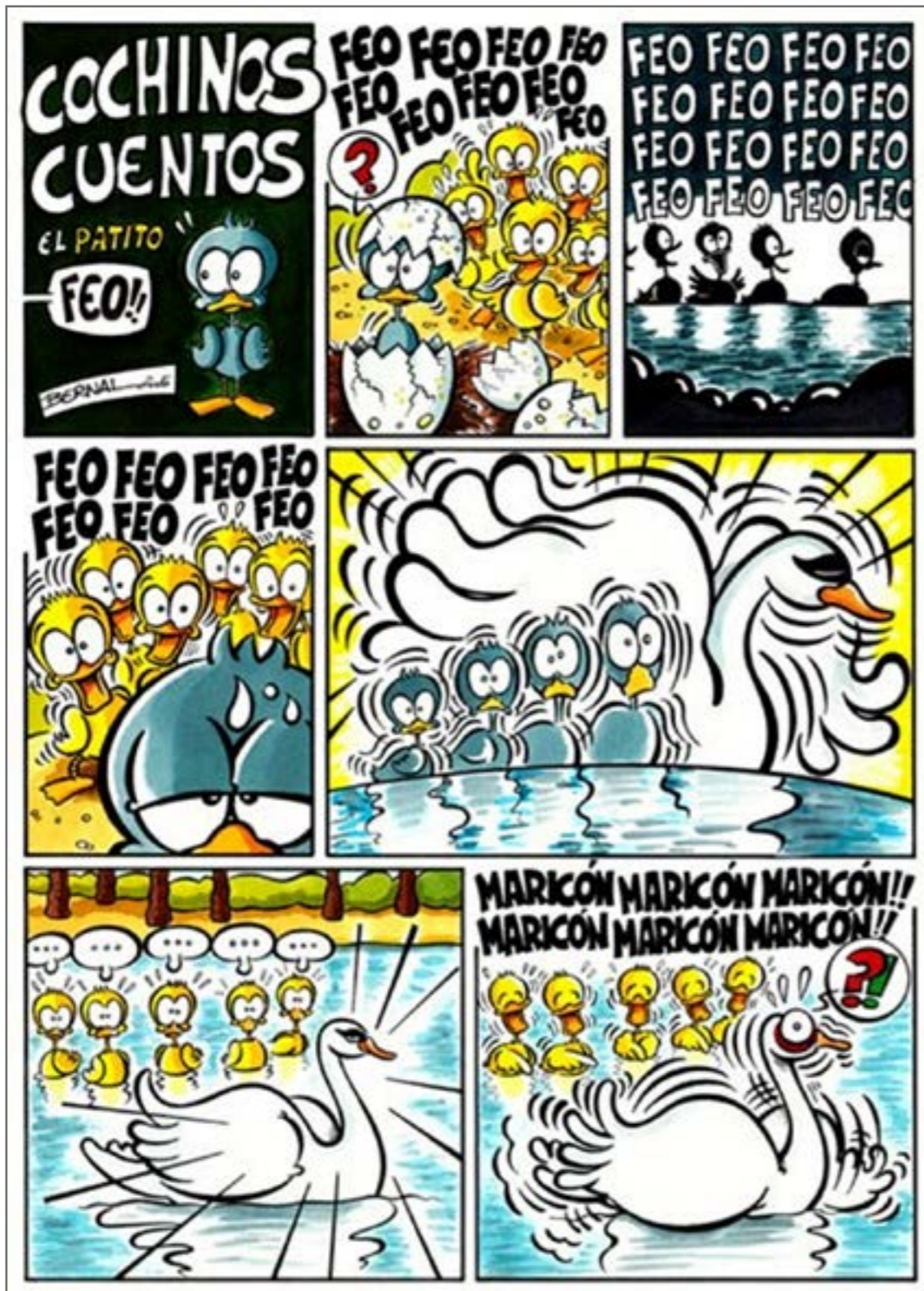
(Il·lustració: J.A. Bernal)