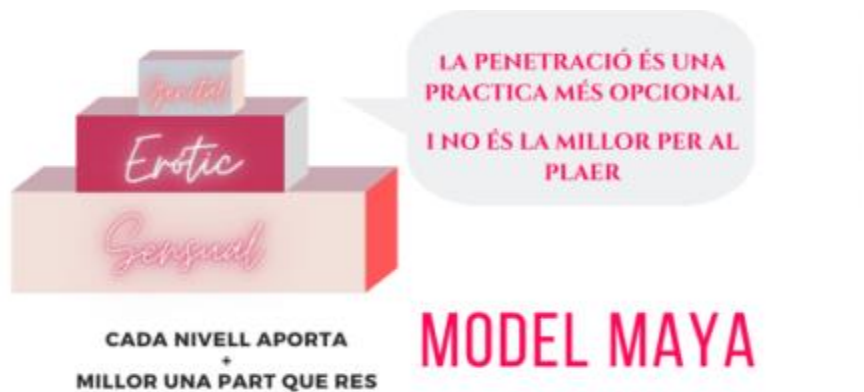
Figura 3. Model Maya