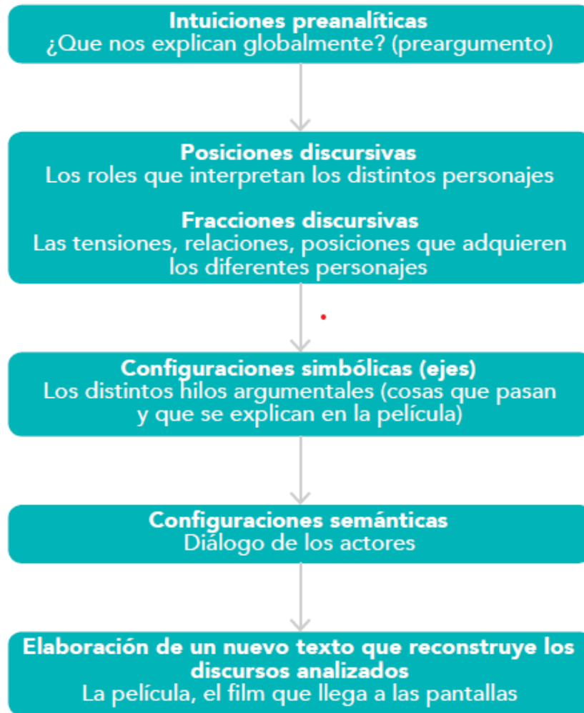
Figura 5. Símil entre els procediments de l'anàlisi sociològica del discurs i el desenvolupament d'una pel·lícula.