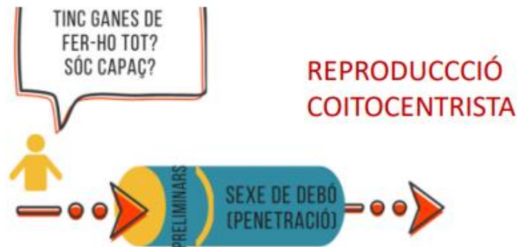
Figura 2. Model Túnel